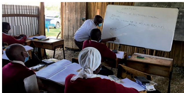
figuur 2 Les uit de nieuwe boeken

De omgeving van de middelbare school overstroomde te vaak, dus werd besloten de school te verplaatsen naar een plek direct naast de basisschool. Na de heropening van de scholen kregen de leerlingen van de middelbare school daardoor tijdelijk les in tenten.