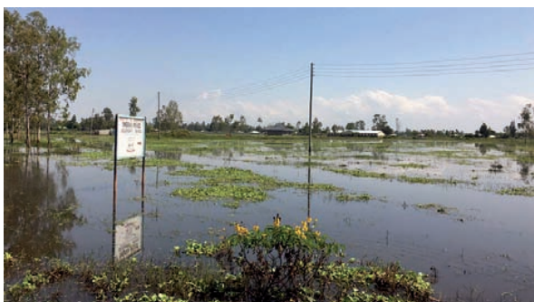
figuur 1 Overstroming op het terrein van de oude locatie van de Ombaka Secondary School

Het enorme Victoriameer, met een oppervlakte zo groot als Nederland en België samen, ligt tussen de landen Oeganda, Tanzania en Kenia. Dichtbij dit meer, in Kenia, ligt het gebied Ombaka. Dit gebied wordt vaak getroffen door overstromingen, en ook in 2020 was dat het geval. Samen met de covidpandemie leverde dit grote uitdagingen op voor het onderwijs. Tijdens de overstroming werd de basisschool gebruikt als tijdelijke huisvesting voor 1200 gezinnen! De staf van Ombaka Secondary School en de NGO 'Safe Water and AIDS Project (SWAP)' hebben ondanks de grote problemen alles op alles gezet om het onderwijs te hervatten toen de scholen weer open mochten. Gedurende de tijd dat de scholen gesloten waren, werd geprobeerd om de leerlingen te bereiken met voedselpakketten. Want 'geen school' betekent voor veel leerlingen ook 'geen maaltijden', omdat de kinderen normaal gesproken op school ook te eten krijgen. De toch al arme gezinnen, waarvan de meeste hun oogst zagen mislukken door de overstroming, moesten dus ineens ook hun kinderen een extra maaltijd geven.