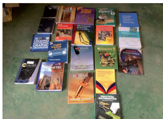
figuur 2 De aangeschafte boeken

Stap voor stap zijn de problemen in kaart gebracht, oplossingen bedacht en projecten gestart om de problemen aan te pakken. Bijvoorbeeld het probleem van de leerlingen die er niet waren. Zij hadden geen geld om schoolgeld te betalen (hoe weinig dat ook is), en haakten halverwege het jaar af. Een ramp voor de leerling, maar ook voor de school. Door het instellen van een studiefonds samen met ouders, de lokale kerk en doopsgezind Wereldwerk worden de uitvallers geholpen en kan vrijwel iedereen die het jaar gestart is nu ook het jaar volmaken. Of een ander voorbeeld, gekwalificeerde docenten: door het opknappen van wat lerarenhuisjes wordt het nu aantrekkelijker om op deze school te komen werken en is het mogelijk om docenten langer te behouden voor de school.